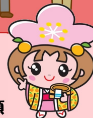
千曲市キャラクター「あん姫」